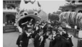
台湾修学旅行(武日コース)

部活動では、「文武両道」の校是のもと、運動部、文化部とも素晴らしい成績を取っています。平成 2 3 年度の主な成績は、柔道部が全日本カデ柔道体重別選手権大会に出場し、吟詠剣詩舞部が第 3 5 回全国高等学校総合文化祭に出場しました。また、その他、九州大会に駒を進めた部活動も少なくありません。