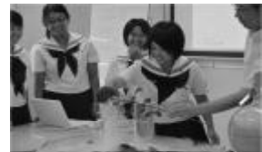
SSH九州工業大学実習